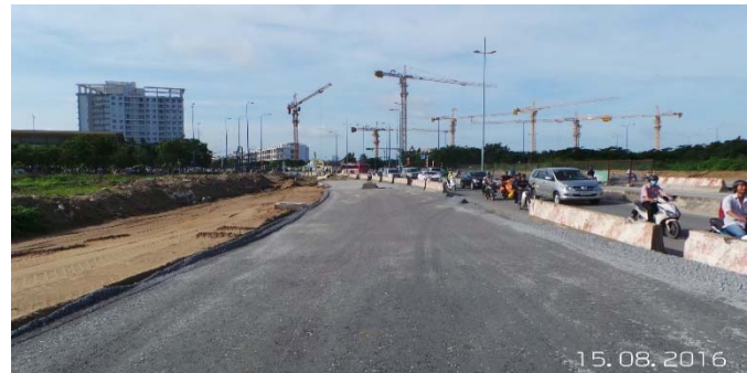
Hiện trạng đoạn trước cầu Cà Trê – Mai Chí Thọ