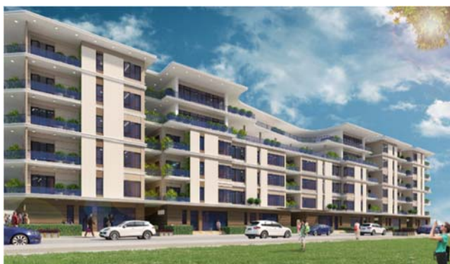
Phối cảnh tổng mặt bằng dự án Lakeview 2