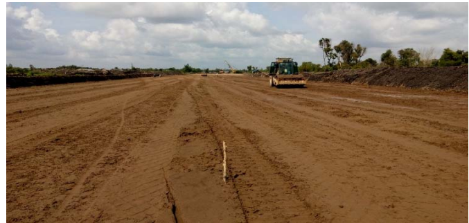
Công đoạn thi công đắp cát đang được triển khai