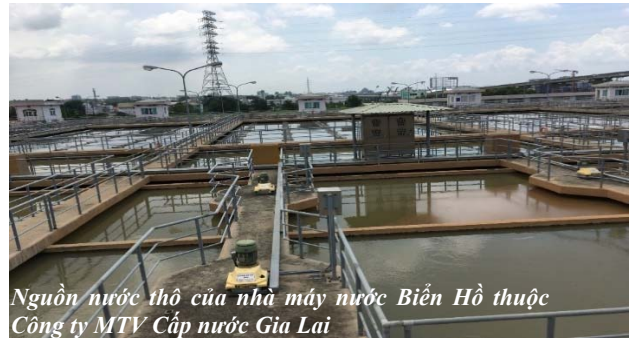
Nguồn nước thô của nhà máy nước Biển Hồ thuộc Công ty MTV Cấp nước Gia Lai