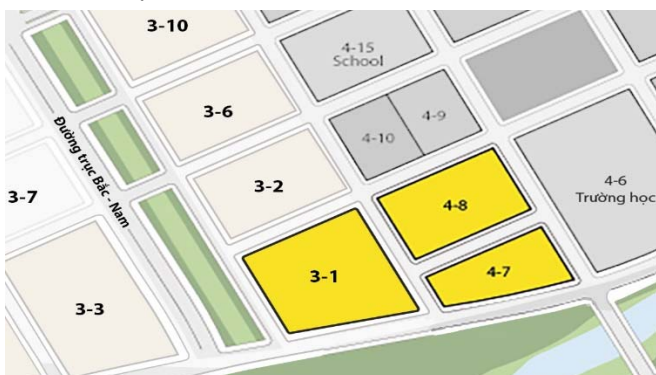
Vị trí cụm dự án Lakeview